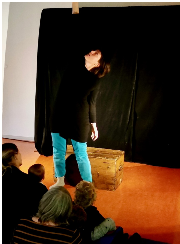
Photo de novembre 2024 lors de la racontée au RPE de Montrevel en Bresse

Petit tour de contes et comptines pour apprivoiser ses peurs. Une pomme magique grossit quand on la mange. Il y a des bruits en-dessous du lit. Un petit ogre ne veut pas manger d'enfants. Quand le soir tombe, vite, vite, tous sous la couette ! Rions entre poltrons.