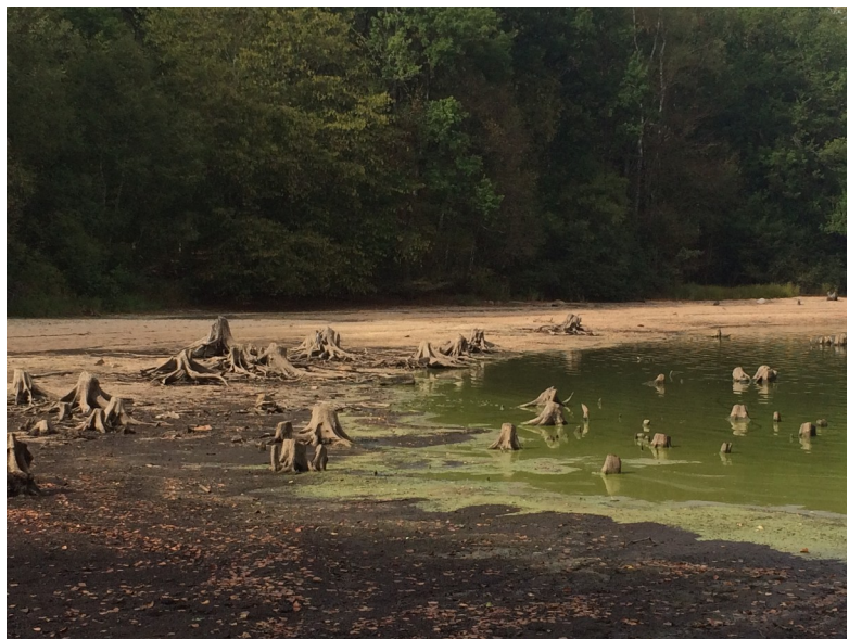
photo de souche d'arbre dites « queules » en patois morvandiau, prise dans le Morvan au lac de St Agnan Résidence MPOB juin 2019 – Les Queules sont les lieux où se cachent les enfants morts sans baptêmes appelés les Queulards.