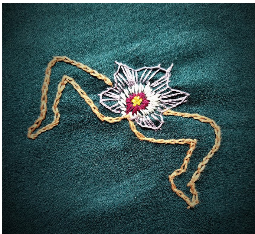
Broderie -Marion Minotti

« Les nuits de nouvelle lune, en bord de mer et à marée basse, des femmes oiseaux prennent leur envol. Elles planent au-dessus du sable mouillé à la recherche de coquillages. Des avortons se cachent à l'intérieur. Ils crient et tendent leurs bras vers le ciel. Les femmes oiseaux les attrapent dans leurs serres. Elles volent à l'intérieur des terres au-dessus des maisons et les déposent dans le rêve d'une femme.