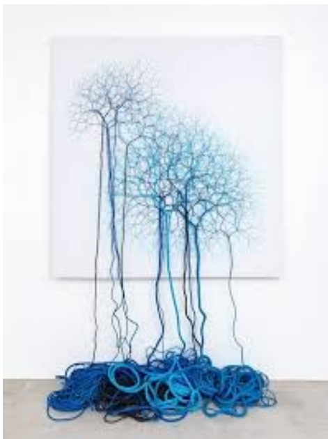
artist : Janaina Mello Landini

Je me suis donc penchée sur ce qui se faisait aujourd'hui dans les arts plastiques féminins contemporains utilisant les matières textiles. Les broderies, les installations faites de fibres et de tissus sont souvent liées au ventre des femmes. Les formes sont organiques et fluide. Ce qui nous rapproche de l'eau, celle de la rivière qui coule, nettoie le linge et les âmes; ou l'eau stagnante d'un étang qui macère et se trouble, inquiétante.