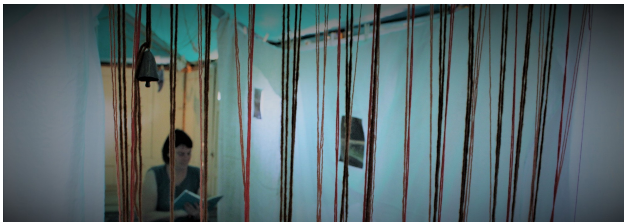
Résidence à la MPOB – le couloir des avortons – installation juin 2019

Pour construire et tisser les éléments de l'histoire il m'a fallu les concrétiser. Le Bal parquet de la Maison du Patrimoine Oral de Bourgogne m'a permis d'aménager cette matière dans l'espace à travers une installation en m'inspirant des créations plastiques textiles contemporaines. J'ai installé une enfilade de pièces faites de draps de coton blanc dans lesquelles se trouvaient des casques mp3 reliés à des témoignages et archives sonores, des planches botaniques de plantes abortives, des fils, des aiguilles à tricoter... Chaque pièce constituait un motif à explorer. Ce travail du geste m'a permis de tisser la dramaturgie de cette création. Il m'a fallu remettre dans le corps et la voix ce qui a été si abondant dans l'espace créé. J'ai travaillé sur l'insertion de motifs de contes et légende dans un univers fantastique où je place les différents témoignages tant personnels que politique que j'ai récolté. En guise de sortie de résidence, le public a été invité à parcourir les pièces dans une balade contée.