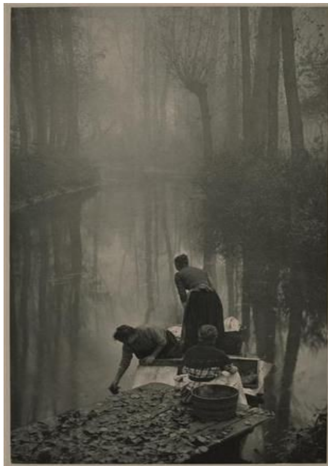
'Les Laveuses' - The washing ladies by Constant Puyo (1857 and 1933).

Les témoignages et le merveilleux se reflètent en miroirs sur l'eau plissé des lavoirs. La conteuse, elle, coud au fil rouge ces récits disséminés en quête d'un héritage oublié.