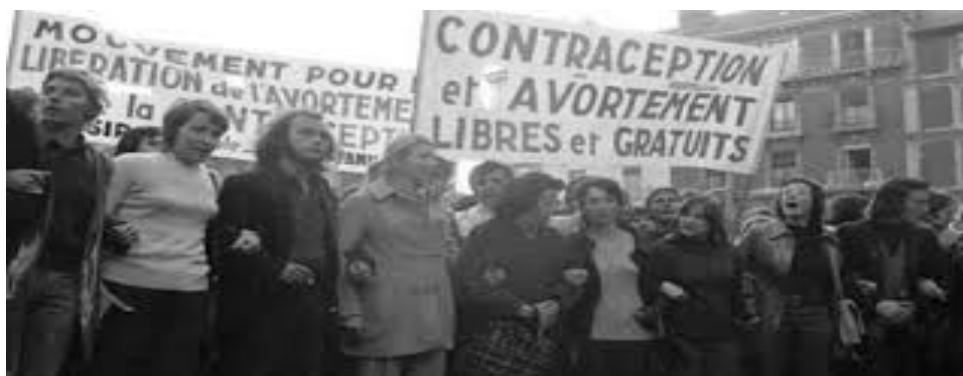
Photo du documentaire « Regarde, elle a les yeux grand ouverts » de Yann Le Masson et le collectif du MLAC - 1982

Après avoir longuement mûrit ce projet, la dimension de la transmission des gestes et des rituels a pris plus de place. Le Théâtre de la Parole m'a accueilli pour une semaine de travail accompagnée par le regard artistique de Catherine Pierloz. Nous y avons retravaillé les aspects liés aux luttes féministes. Je me suis particulièrement intéressée au groupe du MLAC d'Aix en Provence qui a lutté après la Loi Veil pour que les femmes puissent continuer à pratiquer les accouchements comme les avortements entre elles. Ce constat m'a amené à trouver la flèche de l'écriture narrative. Les femmes se transmettent les savoirs faire autour de leurs ventres et de leurs sororités. Les contes et les chants nous transmettent les rituels qui nous relient entre nous et entre nous et les mondes invisibles.